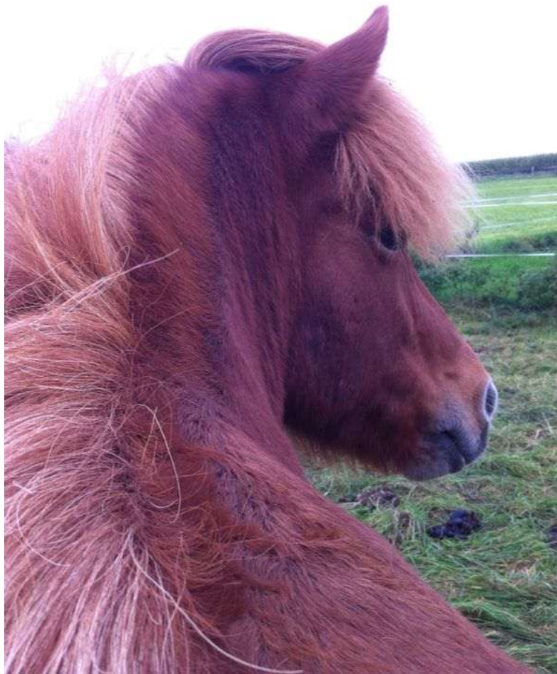
Glira schaut zurück

Sowohl der Allschwadur wie auch unsere Website: Beides hat mir immer sehr viel Spaß gemacht. Aber jetzt – nach 8 Jahren im Geschirr – übergebe ich das Stöckchen gerne! PJ