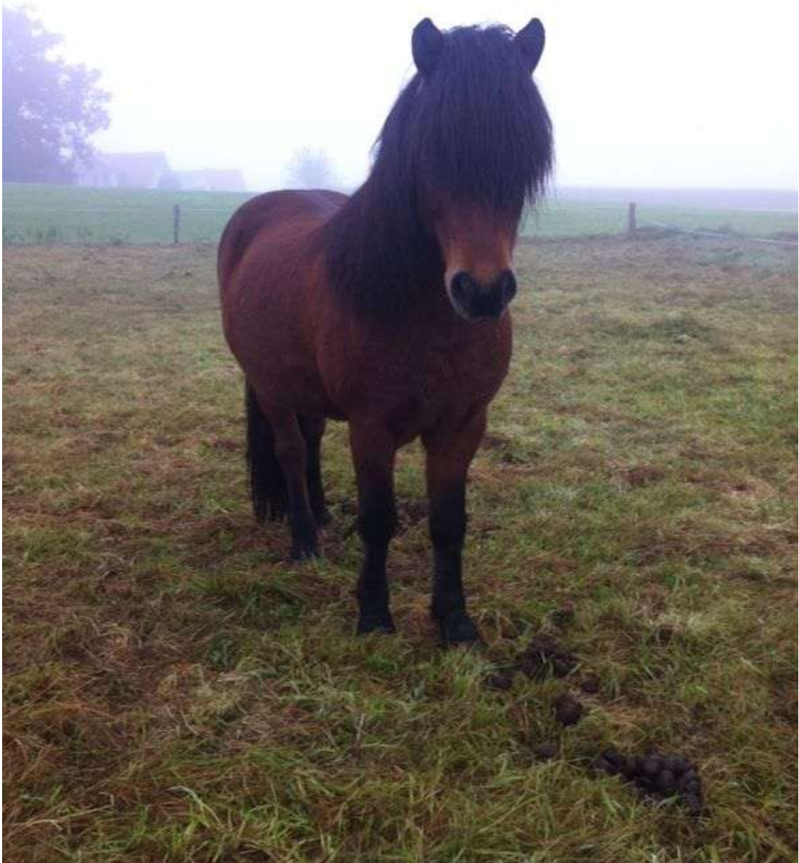
Friedliche Winterweidezeit

Vereinszeitung des IPZV-Allgäu/Schwaben e.V. Ausgabe 03/14