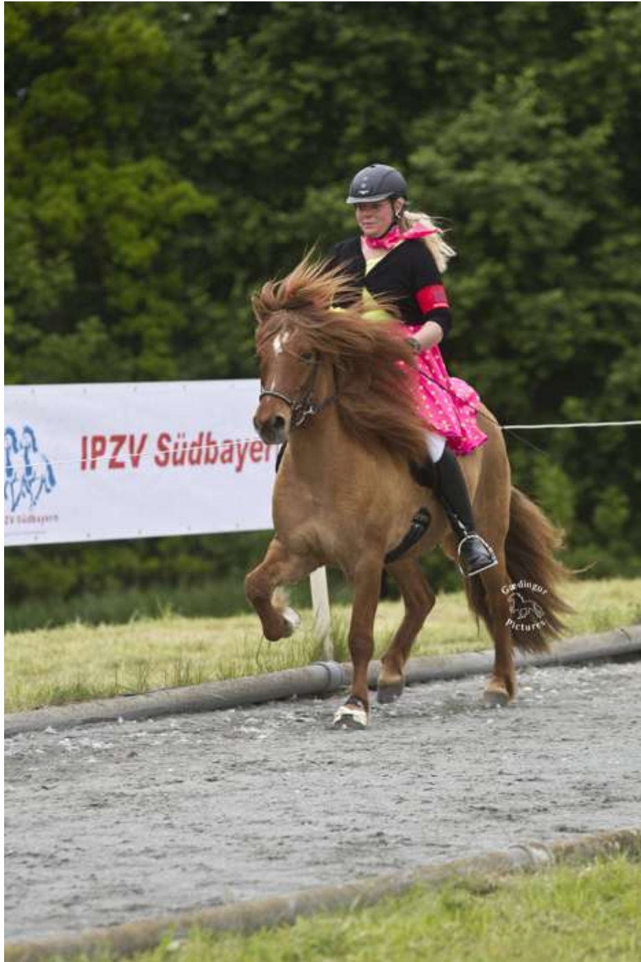
Zwei wehende Mähnen

Auf dem Turnierplatz herrscht bereits reger Betrieb. Wir haben Glück, dass unsere Paddocks und Wohnwagenstellplätze von Sarah und Melina bereits aufgebaut wurden.