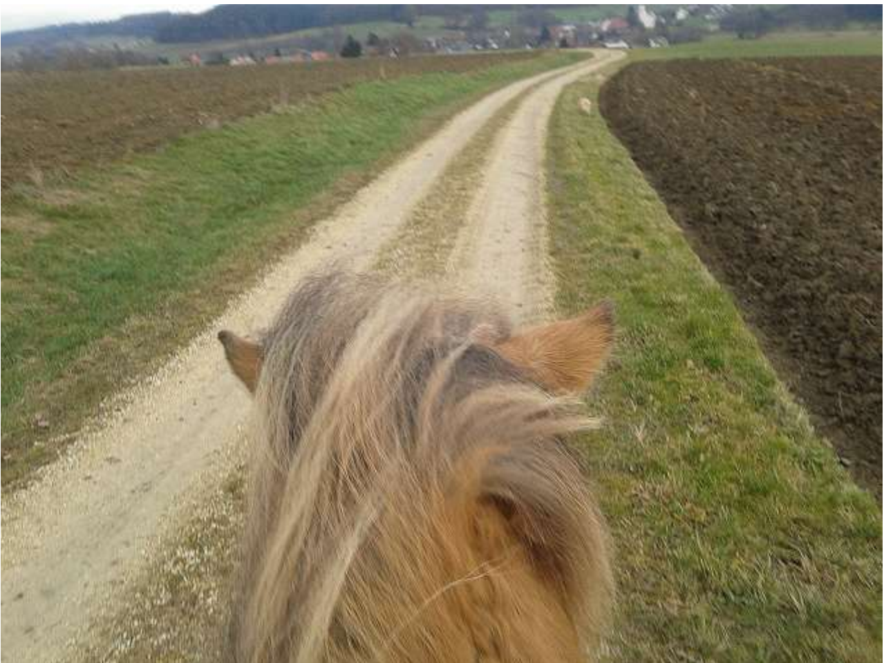
Neue Wege sind immer gut

Kleinanzeigen sind für unsere Mitglieder kostenlos!